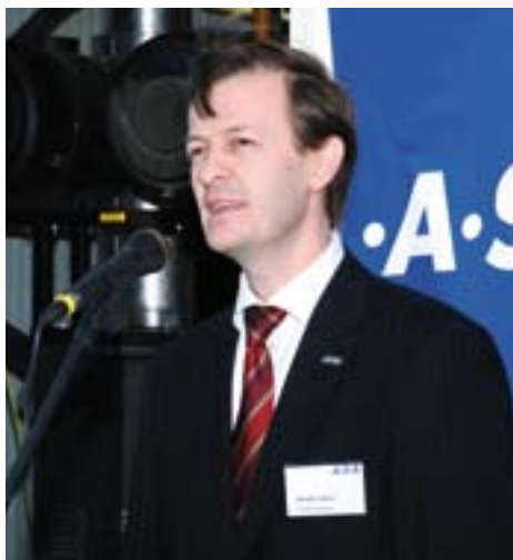
Új vezető az .A.S.A.-nál