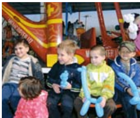
Megújulás -- értük