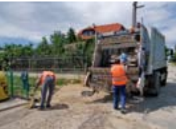
Takarítás egy érdi szelektív szigeten

Az iparszerű lopás akkor kezdődött, amikor a nagyobb áruházak, csomagolóanyag-forgalmazók maguk is elkezdtek visszagyűjteni a csomagolóanyagot. A termékdíjmentesség elérése érdekében néhány áruházlánc valamilyen darabáron átveszi a hasznosíthatóság szempontjából nagyértékű PET palackot és fém italos dobozt. A darabonkénti néhány forintos díj sajnos kellően ösztönző elem a fosztogatók számára is. Ha nem találunk megoldást erre a problémára, attól félek, hamarosan múlt időben beszélhetünk a lakossági szelektív gyűjtésről Magyarországon.