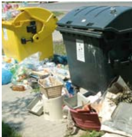
Takarítanivaló egy vásárhelyi szigeten

Mert 2009 őszétől nagyon kellemetlen tendencia bontakozott ki. A gyűjtési napon kihelyezett zsákokat iparszerűen ellopják! Mire a begyűjtést végző munkatársunk beállna egy utcába, már nincs kint egyetlen zsák sem. Teljes utcákból és városrészekből tűnnek el a zsákok. A hatósági eljárás eredménytelen volt, pedig bárki láthatja az eseteket. Idén eddig egyetlen kg műanyagot sem tudunk átadni a hasznosítónak.