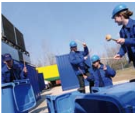
Szól a Hulladékszimfónia